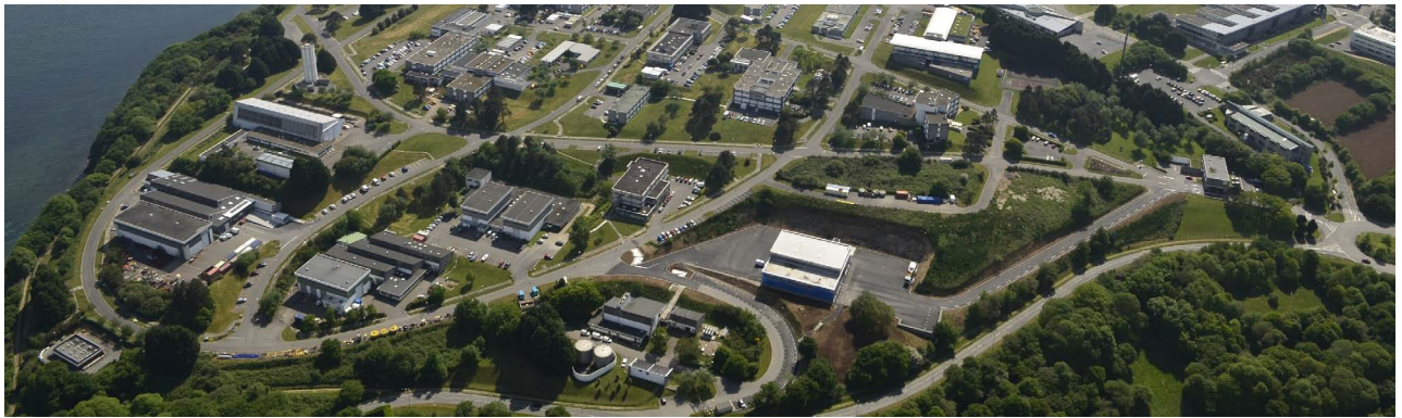
Technopôle Brest Iroise, Plouzané

logistique...). À ce titre, les ZAE constituent des espaces à aménager (accessibilité, qualité des services, immobilier adapté, insertion environnementale...) pour répondre aux besoins économiques difficiles à satisfaire en zone urbaine. Face aux risques contentieux croissants liés aux conflits d'usages et au développement du phénomène NIMBY (Not in my backyard), il est important de rappeler que les ZAE participent à la dynamique économique des territoires.