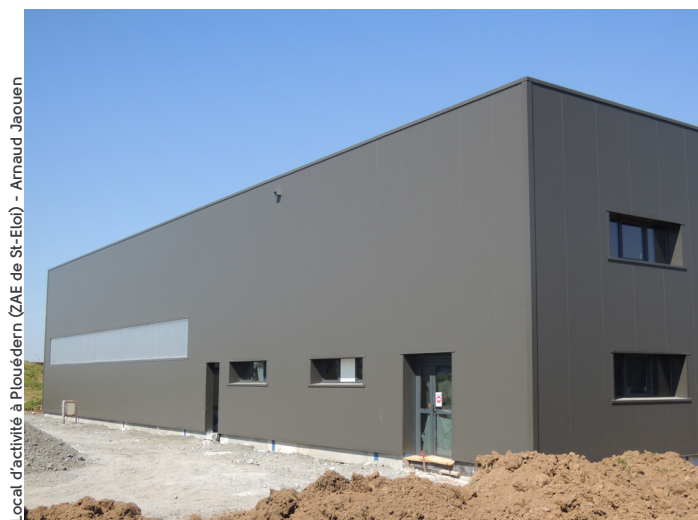
Local d'activité à Plouédern (ZAE de St-Eloi) - Arnaud Jaouen

Le secteur Nord-est (55% de la vacance de Brest métropole) n'est composé que de biens anciens. Suite au départ d'Eurodif, les disponibilités de la zone de Kergonan, particulièrement rue de l'Eau Blanche (11 000 m 2 ), peinent à trouver preneur et atteignent désormais un niveau conséquent. La zone de Kergaradec 1 propose également de nombreuses opportunités avec près de 10 000 m 2 disponibles.